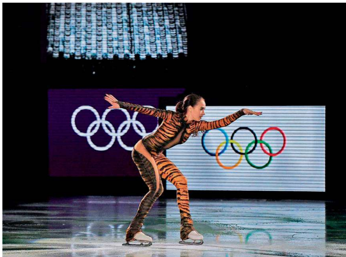
РОССИЙСКАЯ ФИГУРИСТКА АЛИНА ЗАГИТОВА во время показательных выступлений на XXIII зимних Олимпийских играх.

Необходимо помнить важнейшие приоритеты развития, которые были приняты летом 2015 года на Совете при Президенте России по развитию физической культуры и спорту и по сути являются своеобразной «спортивной дорожной картой».