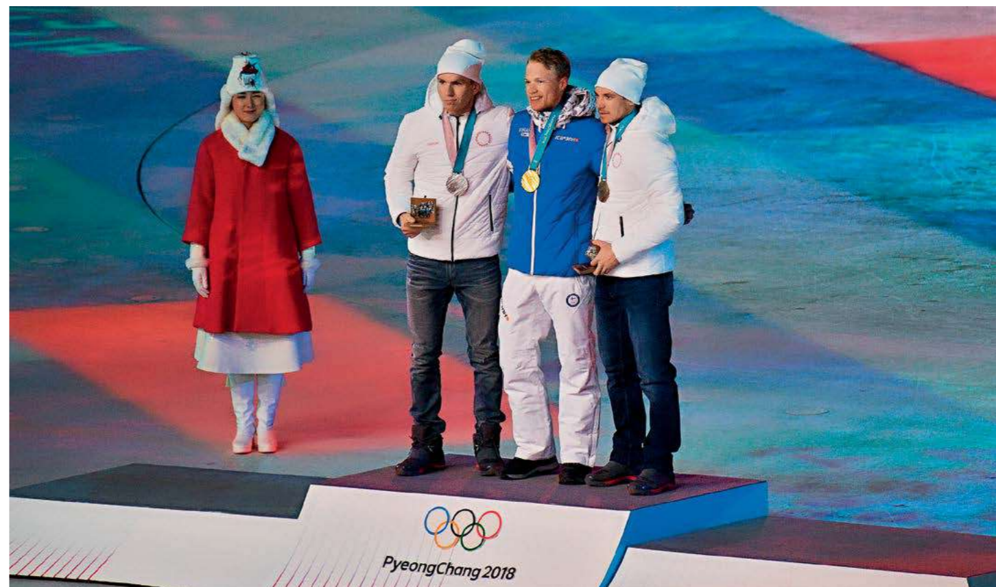
ПРИЗЕРЫ ЛЫЖНОЙ ГОНКИ на 50 км классическим стилем среди мужчин с масс-старта во время церемонии награждения (слева направо): Александр Большунов (Россия) – серебряная медаль, Йиво Нисканен (Финляндия) – золотая медаль, Андрей Ларьков (Россия) – бронзовая медаль.