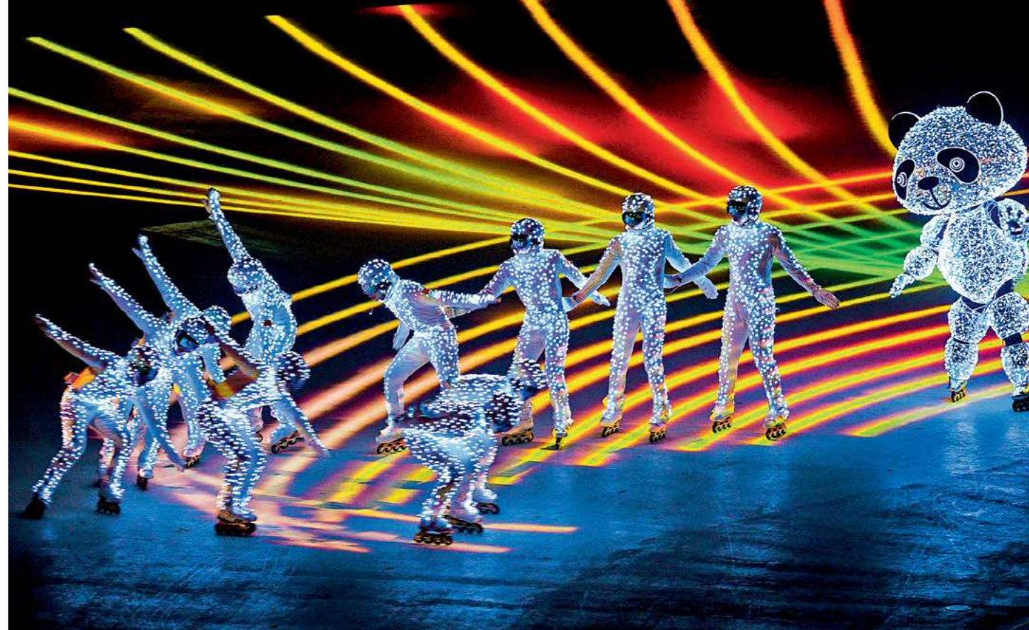
НА ЦЕРЕМОНИИ ЗАКРЫТИЯ XXIII зимних Олимпийских игр в Пхенчхане.

олимпийского движения и является единственным владельцем прав на проведение двух крупнейших мультиспортивных соревнований в мире (летние и зимние Олимпийские игры).