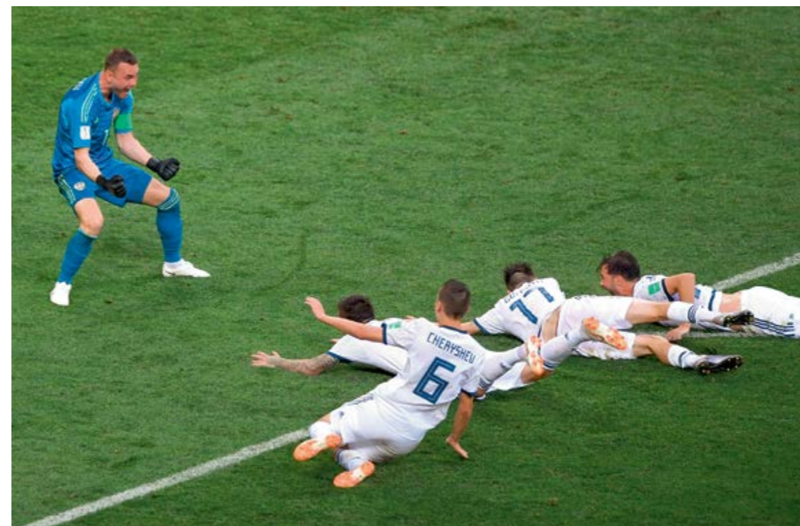
ВРАТАРЬ ИГОРЬ АКИНФЕЕВ (РОССИЯ) и игроки сборной России радуются победе над сборной Испании в матче 1/8 финала.

В чемпионате мира участвовали 32 сборные команды. Наверное, у каждой страны была своя