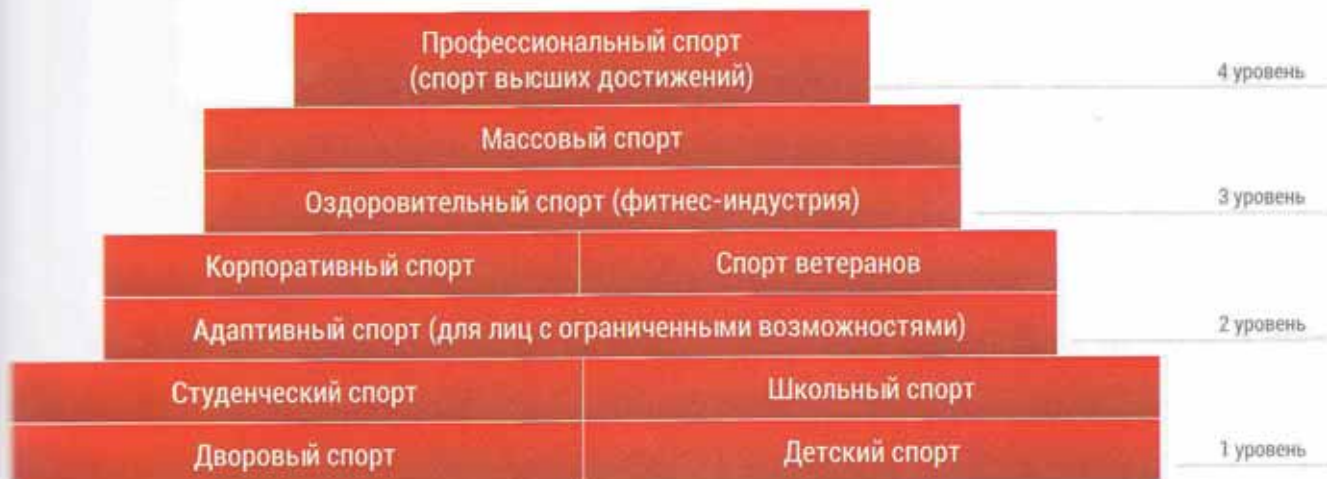
Таблица #01. Основные сегменты российской индустрии спорта